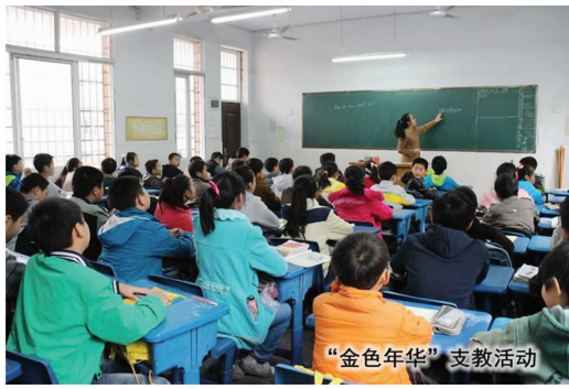
“金色年华”支教活动

为了加深同学们的环保意识,推进环保知识的宣传,校学生会文化交流部举行了以“公益自然,素颜蓝天”为主题的演讲比赛。比赛形式不限,