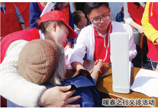
暖春之行义诊活动