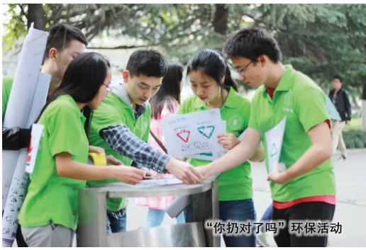
“你扔对了吗”环保活动