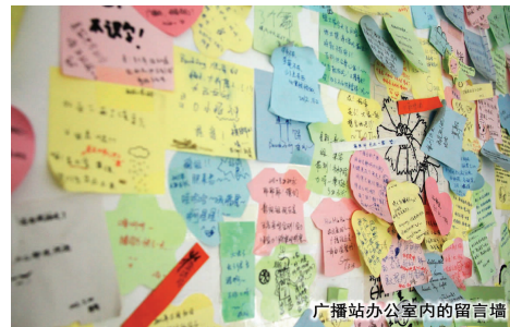
广播站办公室内的留言板

血与情感的交织。但作为这个队伍一分子的成员却笑着表示,这点儿付出与自己对播音的热情相比较,根本不会成为负担。相反,他们将自己对播音的热情毫无保留地奉献给了广播,奉献给了川北医学院。