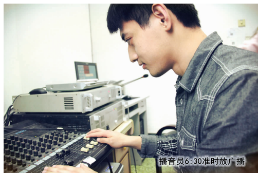
播音员6:30准时放广播

闻,帮助大家了解社会热点,关心国家大事。新闻小组的存在让我们医学生在学习专业知识的同时更能够清楚地了解到当今社会的发展。与此同时,新闻组还会及时为大家提供针对校园动态的身边新闻,以便于同学们及时了解学校的新走向,鼓励大家积极传递,说出心中的真实感受。周二的文学栏目选播中外名家的优秀作品,力求语言精炼,意境深远。不仅弘扬了一种积极的生活态度,更培养了医学生的人文素养。周三的影视栏目与同学们一起分享各种各样的经典或是最新的影视作品,用一种全新的视角解读经典,偶尔推荐一些不落俗套