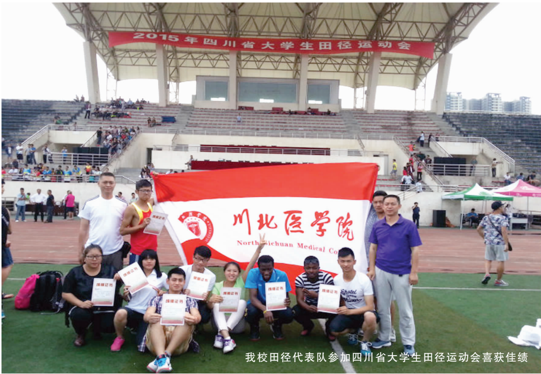
我校田径代表队参加四川省大学生田径运动会喜获佳绩