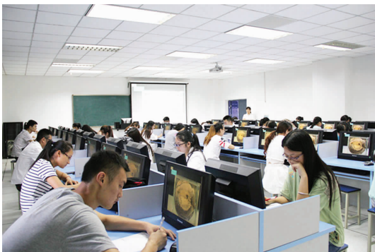
基础医学院第三届病理实验技能大赛

基础医学院第四届化学实验技能比赛在分析中心举行,共吸引了来自临床、口腔、麻醉、检验、药学等专业的150余名同学和15支团队参赛。经过初赛和决赛两轮激烈角逐,评选出一等奖2名,二等奖4名,三等奖8名。